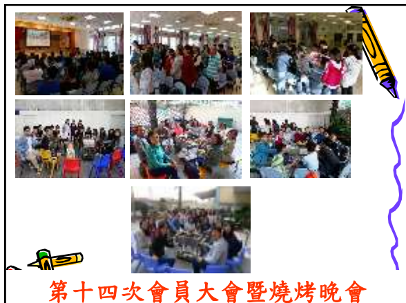
第十四次會員大會暨燒烤晚會